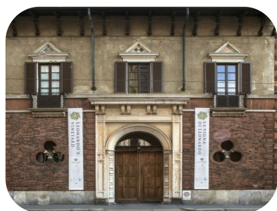
Casa degli Atellani